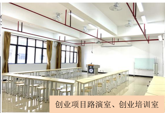
创业项目路演室、创业培训室

2021 年，学校在就业创业 e 站建立大学生创业苗圃，安排有孵化前景的大学生创业项目免费进驻。同时，学校选派了 13 名优秀教师分别参加了 SYB 创业师资培训班、网络创业师资培训班、“青创营”广东高校创新创业师资培训班。此外，我校还聘请 14 名校外专家担任我校大学生创业导师，不定期来校开展创业辅导与咨询活动。