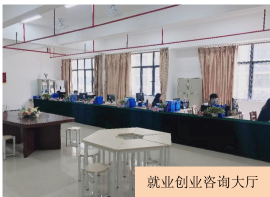
就业创业咨询大厅