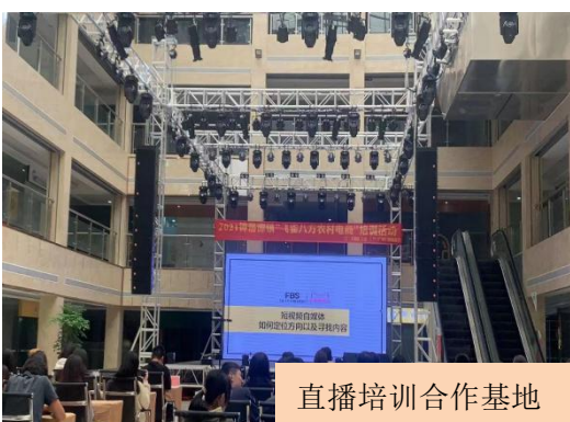
直播培训合作基地

2021 年，我校共邀约校外专家来校举办了 10 场就业创业专业专题讲座，累计 1323 人次学生受益；联合八方盛世电商直播基地，举办了“互联网+营销”技能培训，有 4 支学生团队参加了基地的“大学生电商直播助农”公益活动，获得良好社会效益。