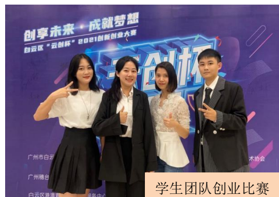
学生团队创业比赛