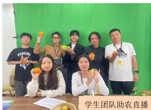
学生团队助农直播

2021 年，我校共邀约校外专家来校举办了 10 场就业创业专业专题讲座，累计 1323 人次学生受益；联合八方盛世电商直播基地，举办了“互联网+营销”技能培训，有 4 支学生团队参加了基地的“大学生电商直播助农”公益活动，获得良好社会效益。