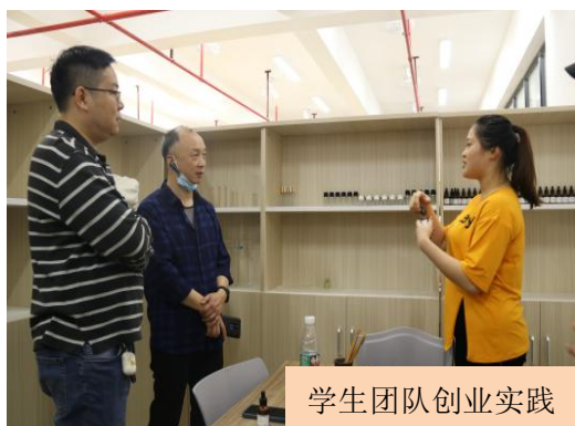
学生团队创业实践

2021 年，学校在就业创业 e 站建立大学生创业苗圃，安排有孵化前景的大学生创业项目免费进驻。同时，学校选派了 13 名优秀教师分别参加了 SYB 创业师资培训班、网络创业师资培训班、“青创营”广东高校创新创业师资培训班。此外，我校还聘请 14 名校外专家担任我校大学生创业导师，不定期来校开展创业辅导与咨询活动。