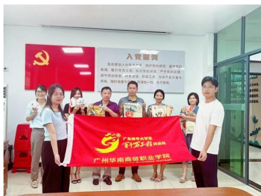
图 3 百千万工程突击队

学校积极推进“星级志愿者”计划，鼓励学生参与社会服务活动。通过到梦空间和 i 志愿平台的管理，学生的志愿服务时长和服务内容都能得到准确记录。目前，“星级志愿者”计划累计服务时长已超过 10 万小时，服务范围涵盖乡村振兴、社区公益、文化传承、信息服务等多个领域。志愿服务电子证书纳入学分认定，既有效激励了学生积极参与社会服务，也实现了学生社会服务成果的可视化呈现。近三年，我校在大学生暑期“三下乡”活动获得全国优秀队伍称号；斩获广东省“百千万工程”突击队行动“百优品牌示范项目”2 项，共建结对 30 余地，建设工作站 12 个，彰显我校师生的社会责任与担当。