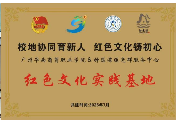
图 4 共建挂牌